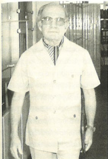
Ο ΛΕΑΝΔΡΟΣ ΖΑΧΑΡΙΑΔΗΣ.

ανία και την ωσε τα απο- ίψεις μας εί- λους. Εάν ο λής της διε- υθεί". Είπαν Α, για να συ-